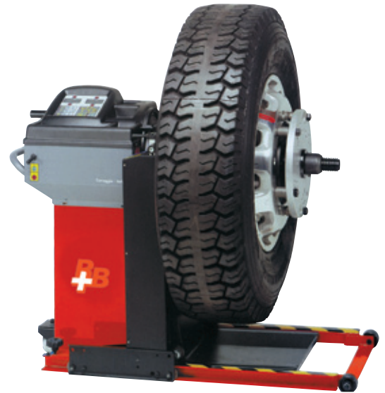
Option PW Set