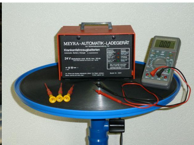
oder als Hilfsplatte bei Testarbeiten