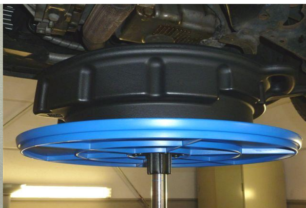
als Abstellfläche für Auffangbehälter